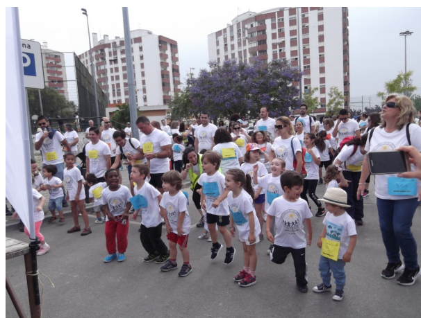
Atividade física em família