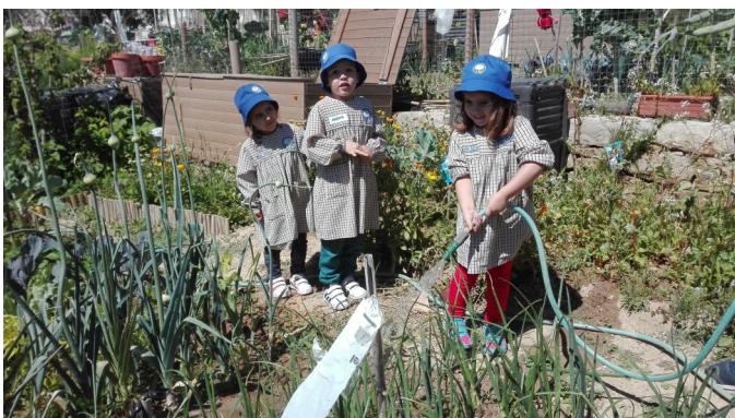
Regar e colher os legumes