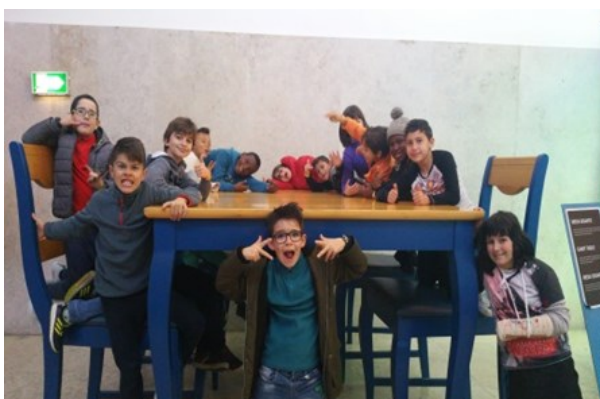
Visitámos o Pavilhão do Conhecimento