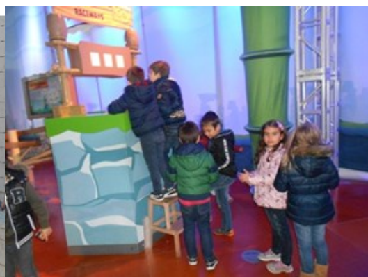
Fomos ver a exposição "Angry Birds"