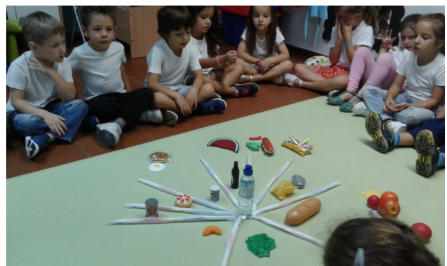
A nossa Roda dos Alimentos