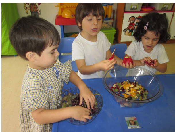
Prova de sabores e cores

Apelamos às famílias que adotem um estilo de vida saudável, inculindo bons hábitos alimentares, a prática da atividade física e o enriquecimento das relações familiares.