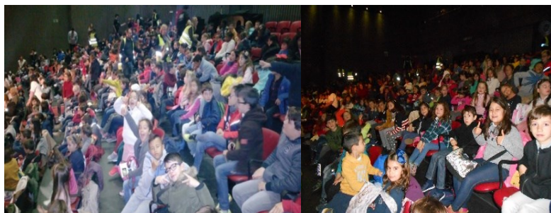
Teatro Armando Cortês - O Soldadinho de Chumbo