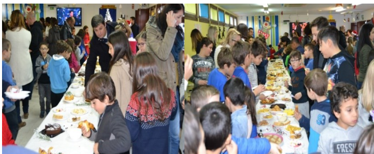
Conviver com as famílias

TEMPO DE CONVIVER EM FAMÍLIA, PASSEAR PELA ARTE E PELA CULTURA, CRIAR E MANTER TRADIÇÕES!