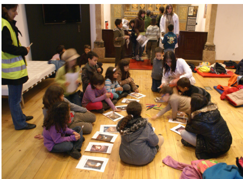
No Núcleo do Mártir Santo, Museu de V. F. Xira, desenvolvemos uma actividade no "Laboratório do Dr. Cotonete";