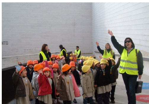
Visitámos o Pavilhão do Conhecimento onde fomos pequenos construtores;