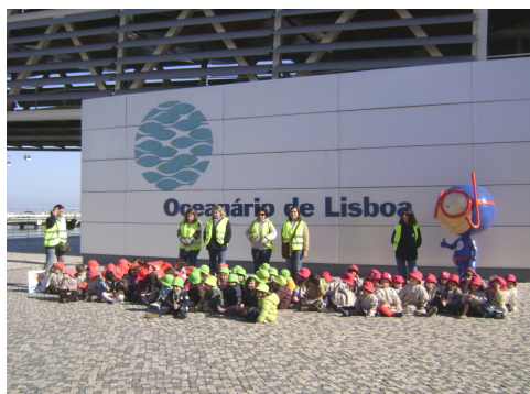
Visitámos o Oceanário de Lisboa, onde descobrimos todos os encantos dos mares;