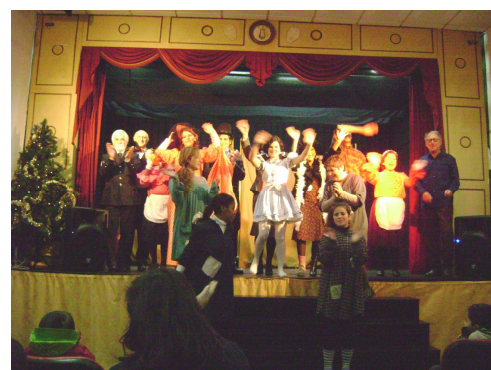
Assistimos à peça de teatro "Annie", no Grémio Dramático Povoense;