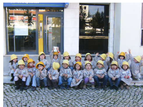
E fomos à Caixa Geral de Depósitos, fazer um depósito a favor do Haiti!