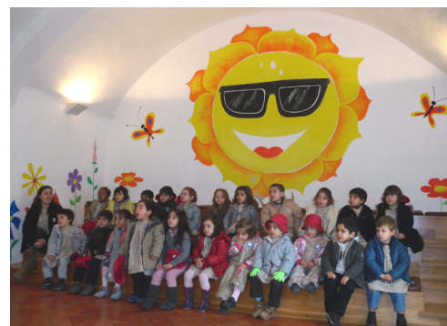
Na Biblioteca Municipal da Qta. da Piedade, assistimos aos "Contos Cubóides";