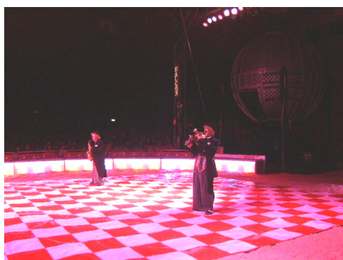
Fomos ao circo festejar o Natal em família;