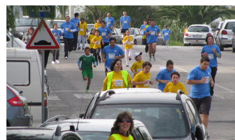
As ruas foram nossas...