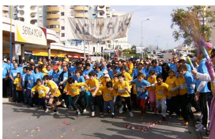
Lá vamos nós...