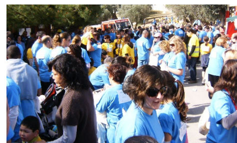
E o convívio foi fantástico!