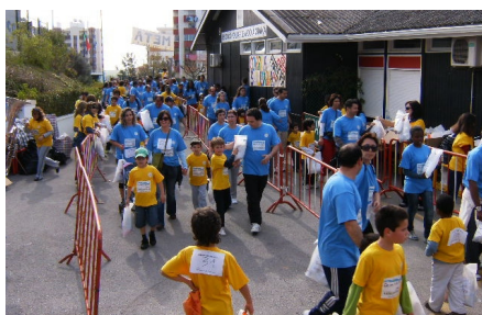
Chegámos todos bem...