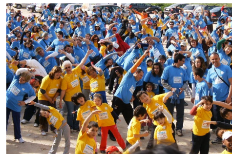
Primeiro, o aquecimento...