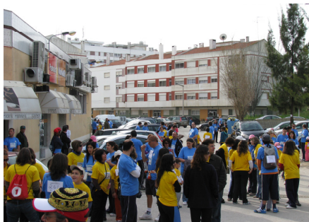
À hora marcada lá estávamos!