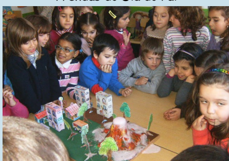
ATL - Vulcões - 1º Ano