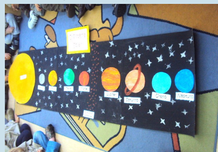
O Sistema Solar