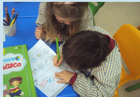
Trabalhos na sala