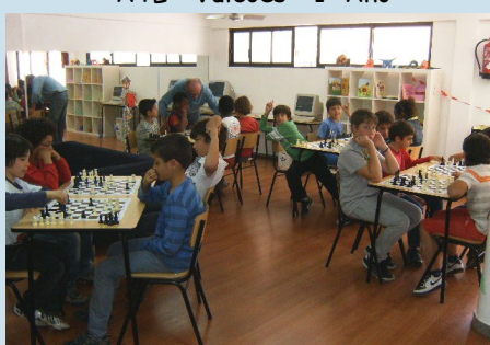
Atelier de xadrez no ATL