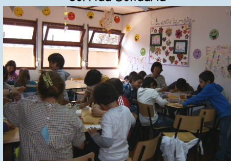
ATL - Atividades - 4º Ano