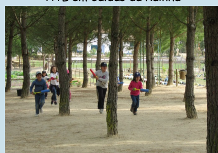
ATL na Academia de Campo