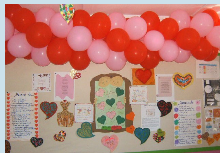
Dia dos Namorados