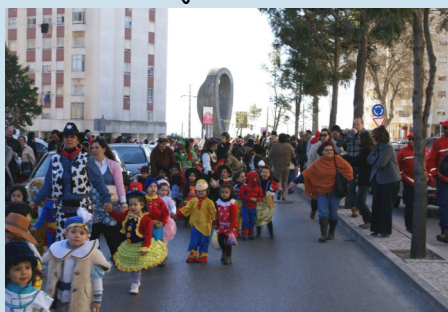
Desfile de Carnaval