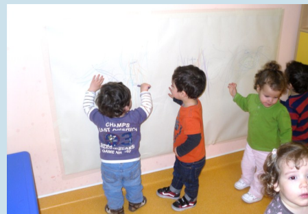
Os nossos desenhos