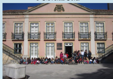
ATL em Caldas da Rainha