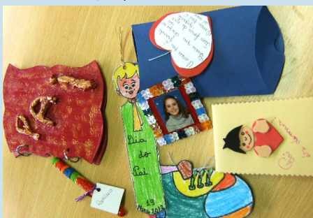
Prendas do Dia do Pai