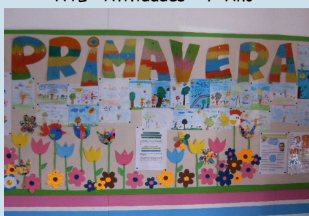
A Primavera no ATL