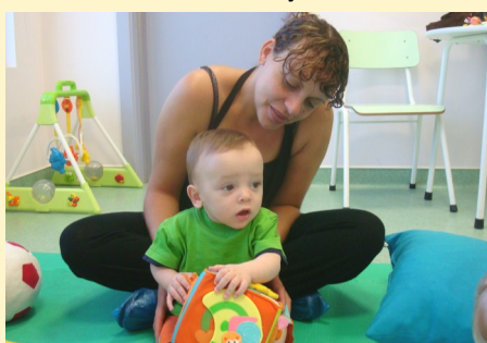
Plano de adaptação - Creche