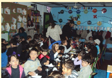
Almoço de Halloween - 4 e 5 anos