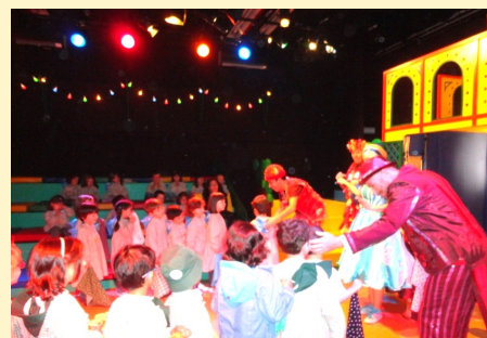
Teatro "A Bela Adormecida" - 4 anos