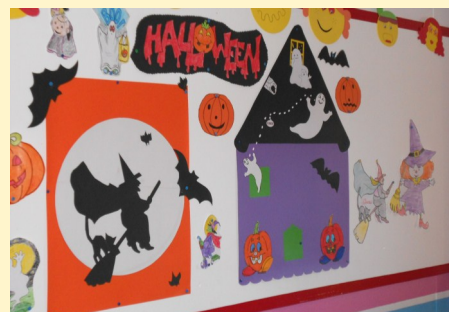
ATL - Painel do Halloween