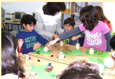
Trabalhos manuais - Ciclo