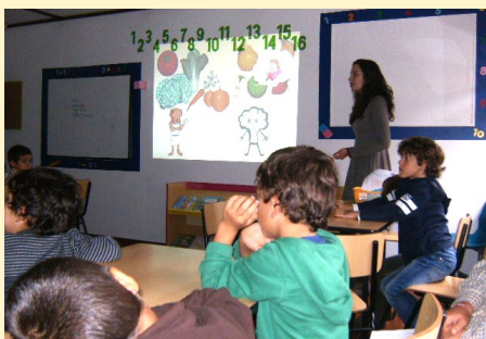
O Dia da Alimentação no ATL