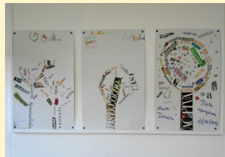
4.º Ano - Painel de Outono