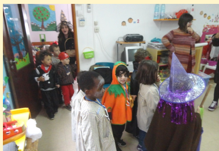
Brincar ao Halloween - 4 anos (Chepsi)