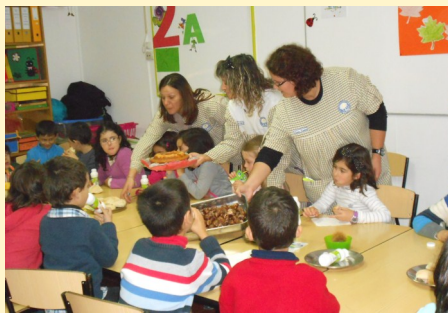
1º-2º ano - Lanche de S. Martinho