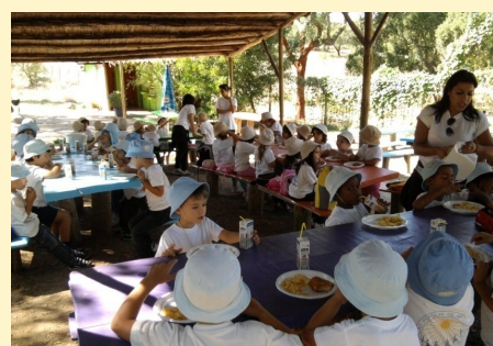
Monte Selvagem - 5 anos (Caniços)