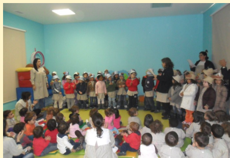
S. Martinho - Creche (II fase)