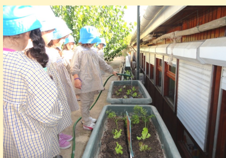
A Horta - 4 anos