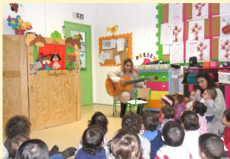
S. Martinho - Creche (Sede)