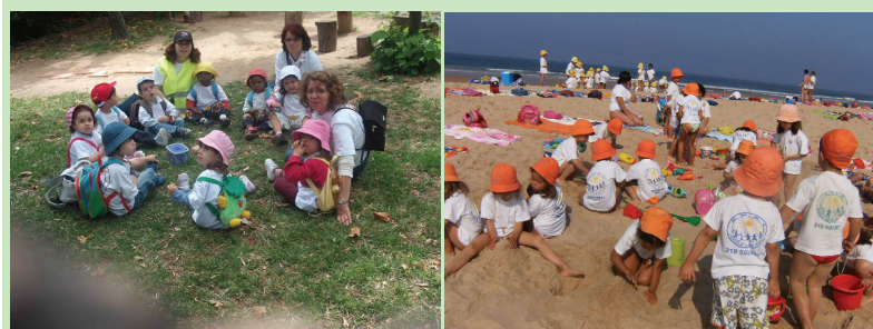
Pic-Nic na Quinta Pedagógica