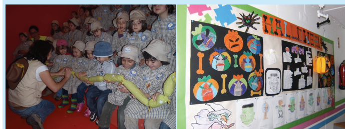
Museu da Criança