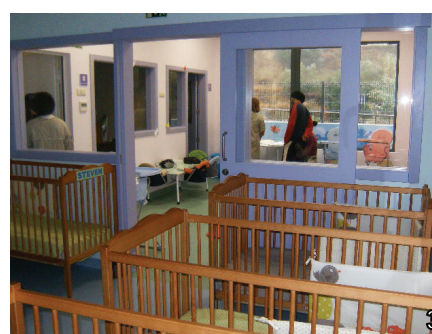
APAC - Nova Creche: 1 - Pormenor do Exterior 2 - Pormenor do Interior 3 - Espaços do Berçário