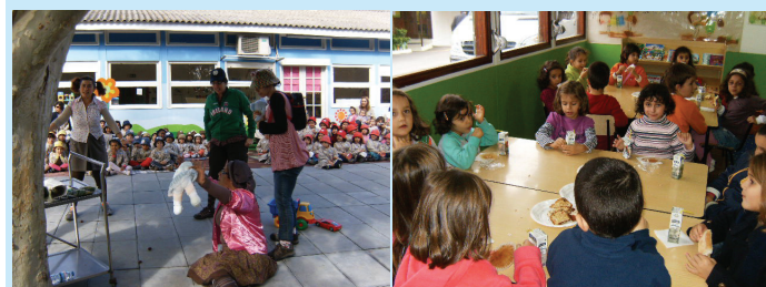
Magusto - Dramatização Teatral e Lanche