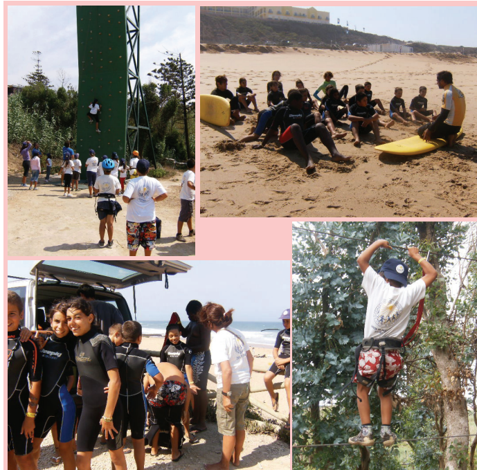
Colónia Fechada - Praia Azul