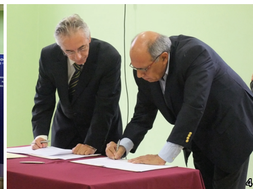
Cerimónia de Inauguração: 1 - Inauguração da Creche 2 - Descerrar da Lápide