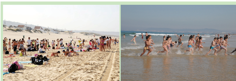
Colónia Aberta - Praia da Saúde