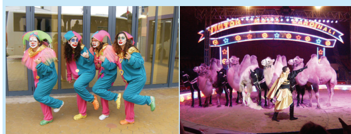
Festa de Natal