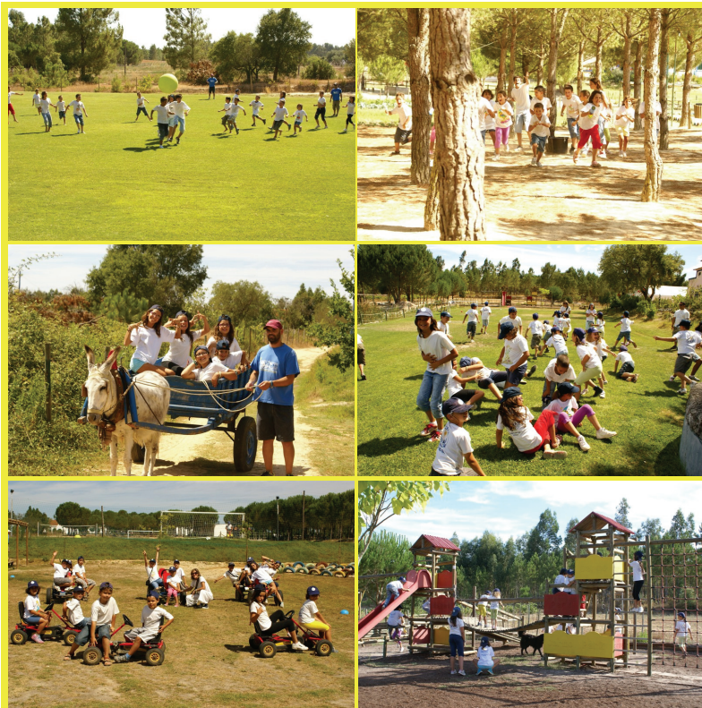
Academia de Campo