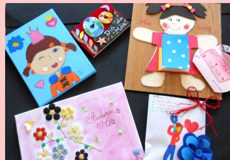
ATL - Atividades Dia da Mãe