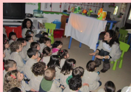
Pré-escolar - Os 5 sentidos: Sombras chinesas