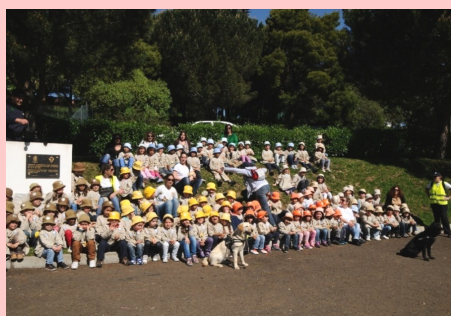
Pré-escolar - Visita à GNR (Queluz)