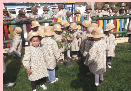
Creche - Dia da Árvore