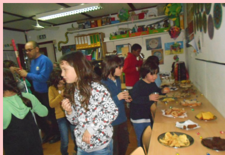
ATL - Festa da Páscoa - 3.º Ano