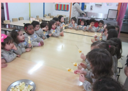
Pré-escolar - Os 5 Sentidos: Os sabores dos frutos