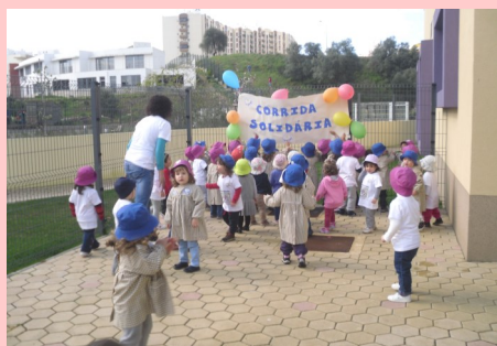
Creche - Corrida solidária