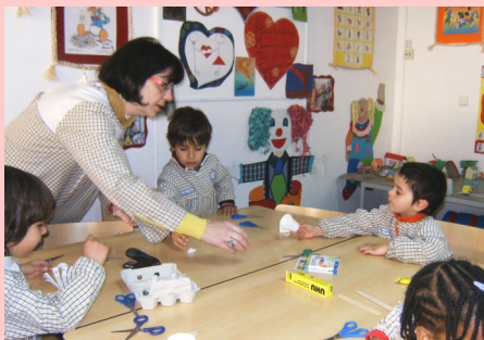
ATL - Transição dos 5 anos com o 4.º ano