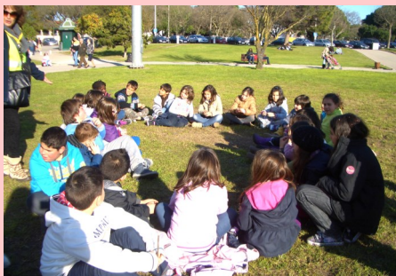
ATL - Jardins de Belém