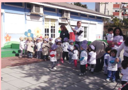
Creche - Corrida solidária