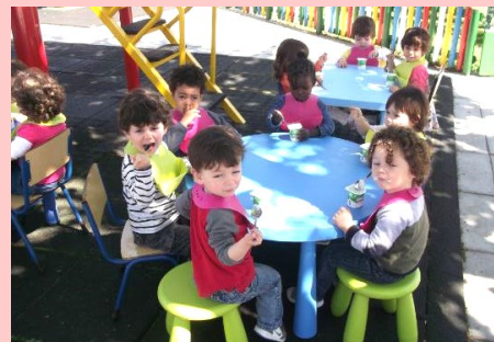
Creche - Lanche da Primavera