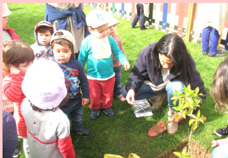
Creche - Dia da Árvore