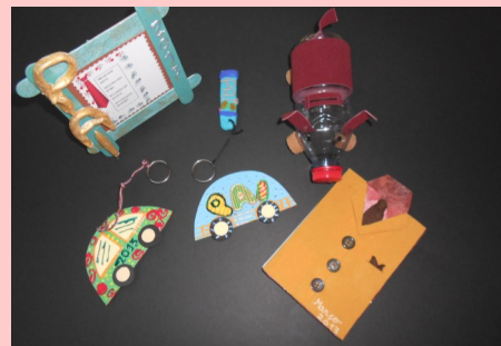
ATL - Prendas do Dia do Pai