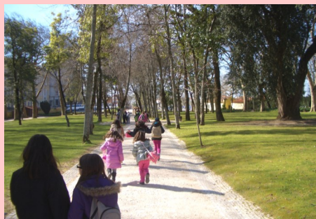
ATL - Passeio a Maфра