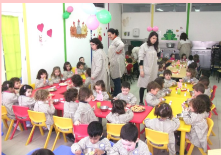
Creche - Festa dos Amigos