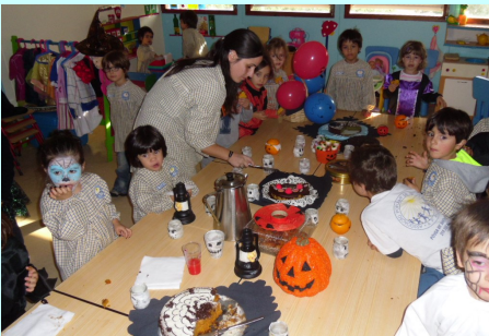
Pré-Escolar 3/4 anos - Lanche de Halloween