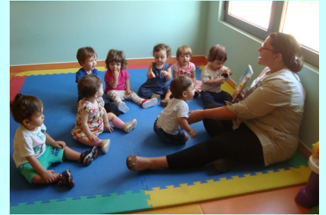
Creche 1 ano A 2ª Fase - Projeto