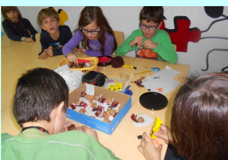
ATL - Construção da Maria Castanha