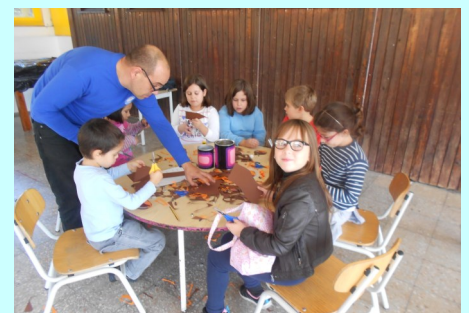
ATL - Recorte de castanhas em cartolina