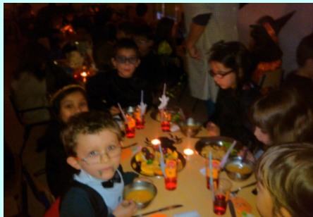
Pré-Escolar 5 anos - Almoço de Halloween