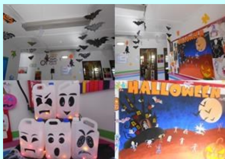
ATL - Halloween