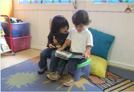
Creche 2 anos B Sede - Projeto

O projeto a desenvolver durante este ano letivo, nas valências da Creche e Creche Familiar, tem como tema “A brincar e a ler aprendemos a crescer”. Desde os primeiros meses, devemos cultivar/incentivar o desenvolvimento da linguagem e da literatura através da musicalidade, teatro, expressão corporal e dramática. Crianças habituadas a ouvir histórias, canções, lengalengas, poesias, a manusear livros e revistas e a frequentar espetáculos, desenvolverão o gosto pela leitura, pelas artes e terão maior facilidade de aprendizagem em todas as áreas cognitivas. Este projeto decorre em três fases distintas, distribuídas ao longo do ano letivo.