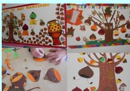
ATL - Trabalhos de S. Martinho