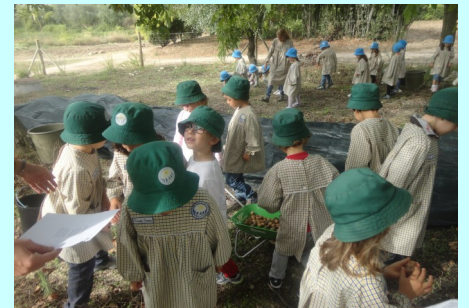
Pré-Escolar 5 anos - Outono - Apanha das nozes