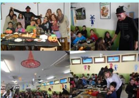
ATL - Halloween