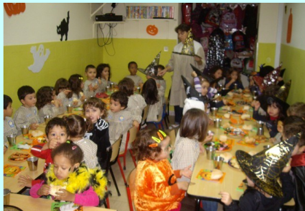
Pré-Escolar Caniços - Lanche de Halloween