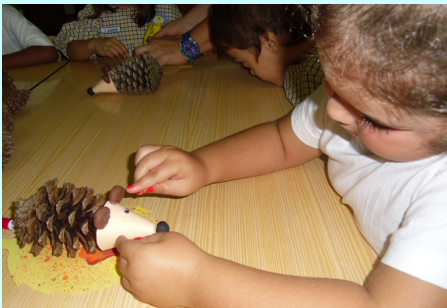
Pré-Escolar 4 anos - Ouriços para a exposição