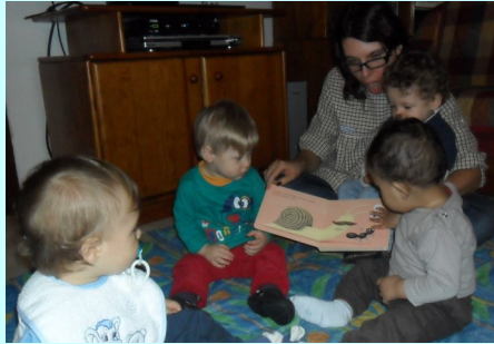
Creche Familiar - Projeto