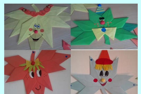
ATL - Origami de Outono