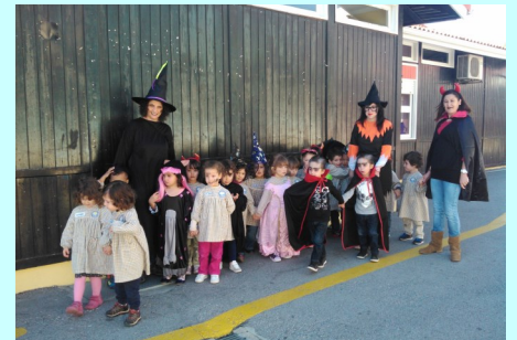
Pré-Escolar CHEPSI - Partidinha de Halloween