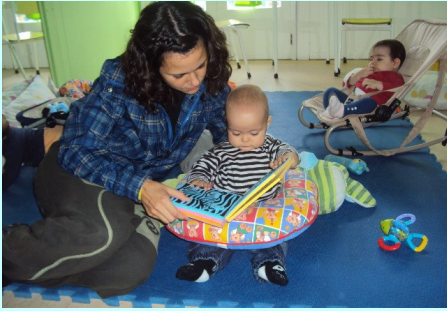
Berçário Sede - Projeto

O projeto a desenvolver durante este ano letivo, nas valências da Creche e Creche Familiar, tem como tema “A brincar e a ler aprendemos a crescer”. Desde os primeiros meses, devemos cultivar/incentivar o desenvolvimento da linguagem e da literatura através da musicalidade, teatro, expressão corporal e dramática. Crianças habituadas a ouvir histórias, canções, lengalengas, poesias, a manusear livros e revistas e a frequentar espetáculos, desenvolverão o gosto pela leitura, pelas artes e terão maior facilidade de aprendizagem em todas as áreas cognitivas. Este projeto decorre em três fases distintas, distribuídas ao longo do ano letivo.